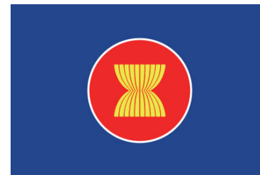
▲ASEANの旗 旗の中央のシンボルマークは、ASEAN加盟国10か国をあらわす10本の稲の茎の束を表し、友好と結束で結ばれた東南アジアのすべての国で構成されるASEANを表しています。