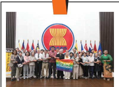
2023年11月訪問時の訪問団