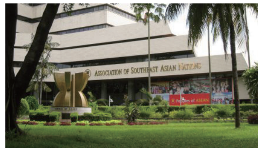
▲ASEAN本部(インドネシア・ジャカルタ)

地域協力としてのASEANは、6億7000万人を超える人口規模で、過去10年間に高い経済成長を見せており、2030年にはASEANの総合GDPは日本のGDPを上回ると推測されています。インドネシアは現在、経済開発協力機構(OECD)の加盟を目指しています。今後、世界の「開かれた成長センター」となる潜在力が、世界各国から注目されています。