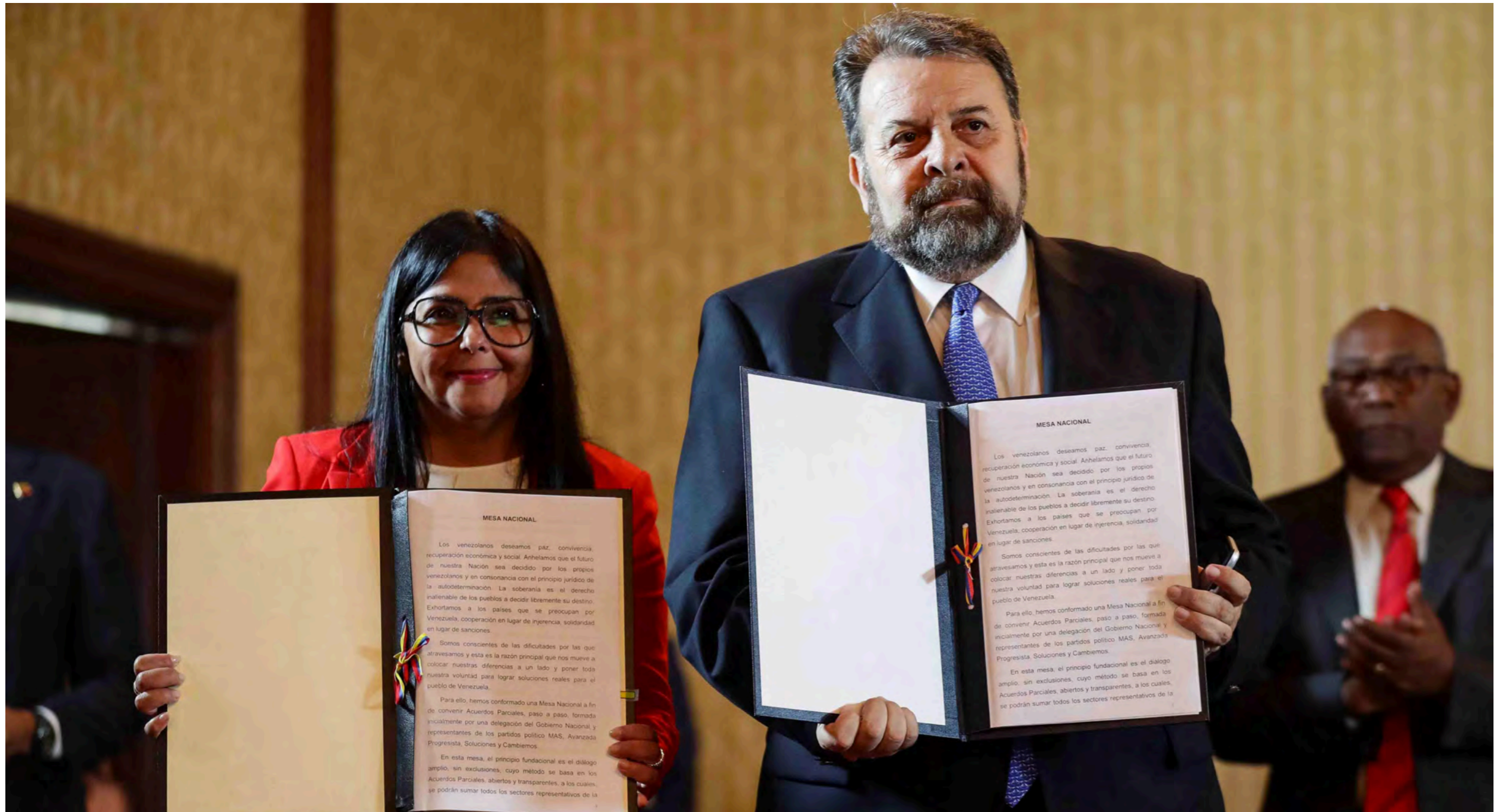
デルシーロドリゲス副大統領