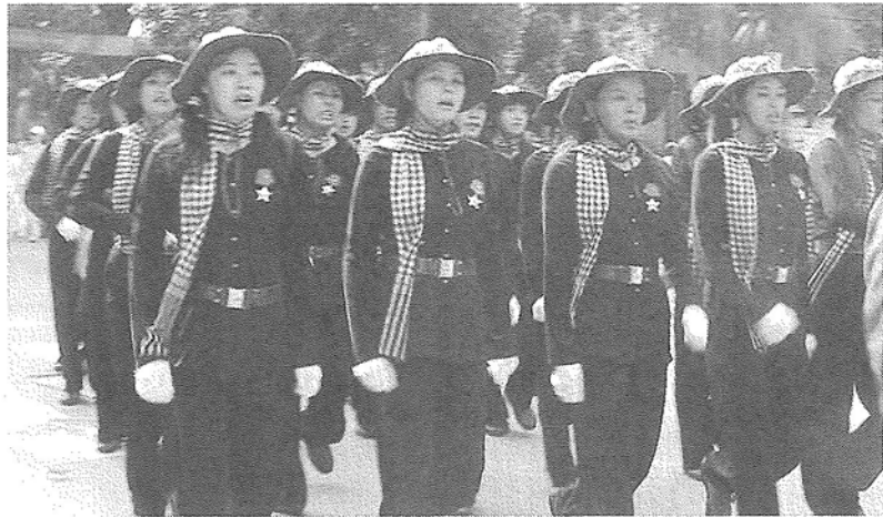
2000年ホーチミン市での開放25周年式典に参加した女性民兵隊

こうした歴史的な体験が、新型コロナウイルスへの対応に役立っている。しかもこれで気を緩めず、その後のヨーロッパでの感染爆発にともない、これら各国からベトナム人が帰国した際も、空