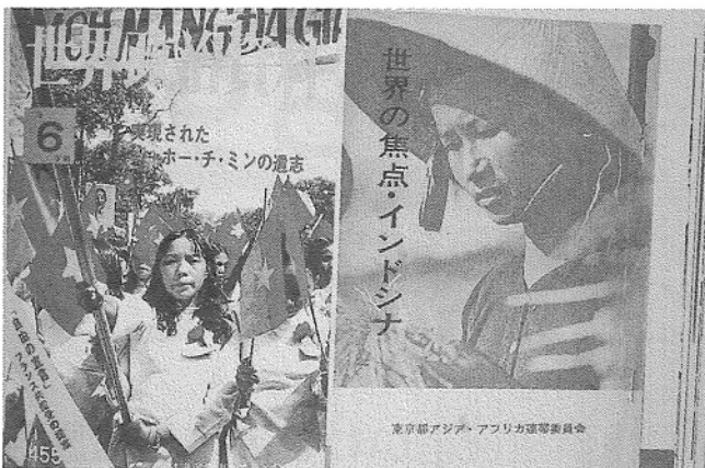
南部解放を特集した日本の出版物の表紙「ベトナムを支援する日本の平和運動」等から

4月1日の会議で明らかにされたベトナムの第1・4半期のGDP（国内総生産）は前年比3・82%の伸びであり、2009年からの11年間で最低となったが、この日までに統計が発表された各国の中ではベトナムの伸び率は最高である。フック首相は会議で、「今後、15日間が、わが国で広い範囲での感染爆発を引き起こすか、否か