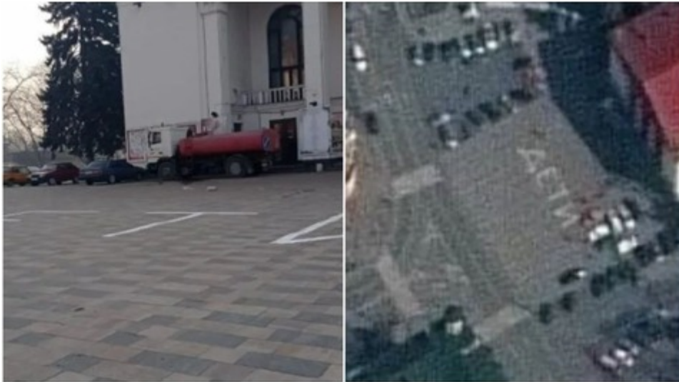
駐車場の写真。左は直後の現場写真、右は数時間前に撮影された衛星写真

この劇場の事件で最も不思議だったのは、爆発が起こる数時間前に、建物前の駐車場からすべての車両が消えていたことである。どうやら、予想される爆風による被害を避けるために撤去されたようだ。